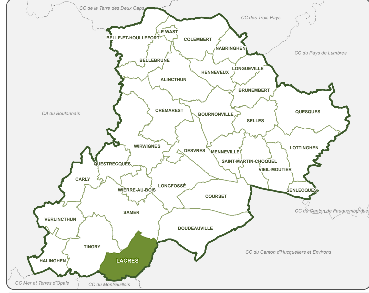
Localisation de la commune sur le territoire intercommunal (1:140 000 eme)

Information : En plus des dispositions représentées au plan réglementaire B, il est nécessaire de consulter les plans réglementaires A et C.