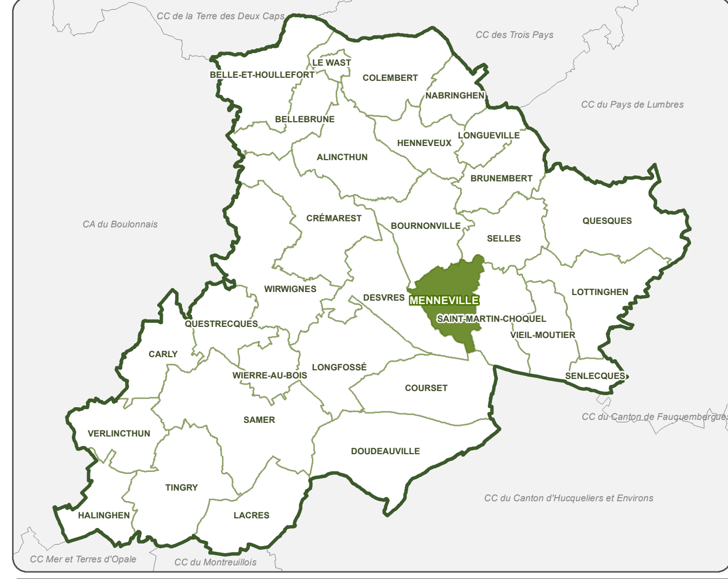
Localisation de la commune sur le territoire intercommunal (1:140 000 eme)

Information : En plus des dispositions représentées au plan réglementaire B, il est nécessaire de consulter les plans réglementaires A et C.