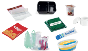
Pots, boîtes, barquettes, sachets, films, tubes...