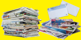
Tous les papiers