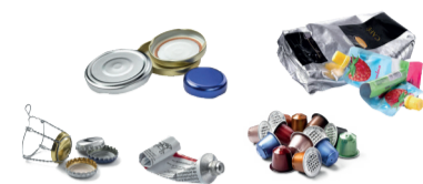
Capsules, sachets, boîtes, tubes, opercules...