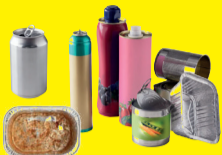
Emballages en métal