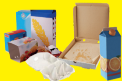
Emballages en papier et carton, briques alimentaires